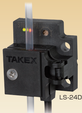
(パイプはイメージです)